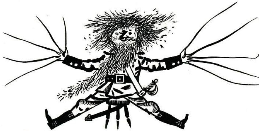
Des Teufels rußiger Bruder

Deinde Iohannes profectus est ad patrem suum, sibi êmit malum amiculum linteum induendum, circumvagans nervis tibiisque canebat, nam hoc apud diabolum in gehennâ didicerat. Regnabat autem quidam rex senex in terrâ, coram quo cum caneret, îdem tanto gaudio elatus est, ut Iohanni promitteret filiam suam natu maximam in matrimonium ducendam. At ista cum audivisset sibi nubendum esse rupici tam vulgari, qui indutus esset albo amiculo linteo: „Potius“ inquit, „aquis me submergam“. Tum rex Iohanni dedit filiam minimam, quae, cum patri esset summâ cum pietate dedita, libenter erat nuptura viro quamvis vulgari. Itaque frater diaboli fuliginosus accepit filiam rêgis, et rêge mortuo accepit totum regnum.